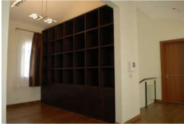
開放式書房文化工作間